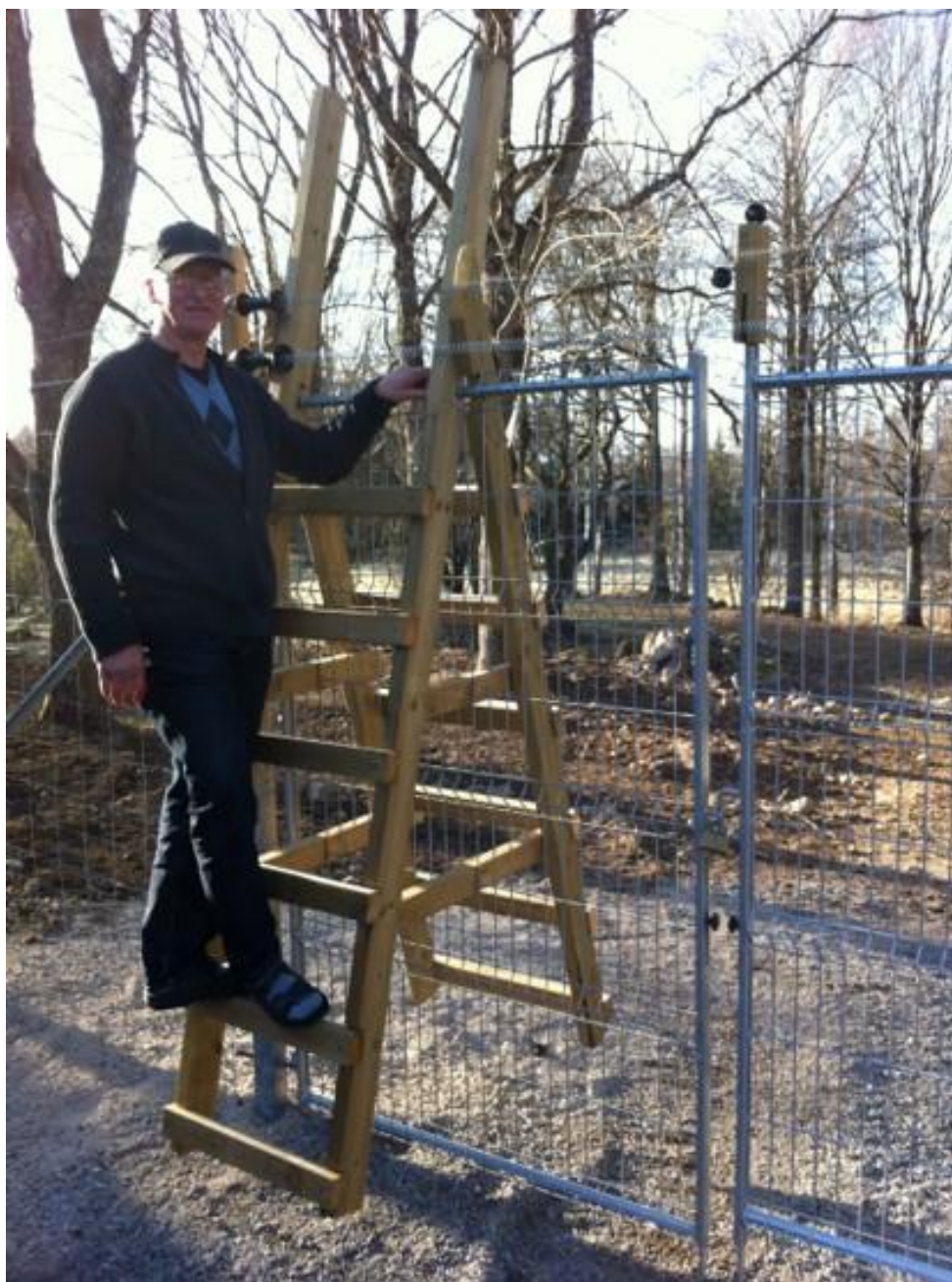
3: Lämplig placering av eltrådar över stätta i vilthägn.