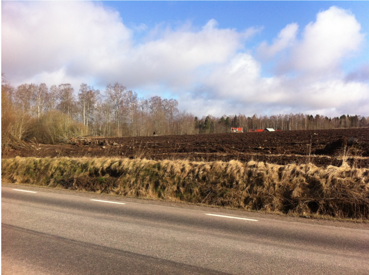
Foto taget vid tillsyn mars 2015 som visar att gen mindre genomgången i stenmuren nu förändrats till ett rejält gap.