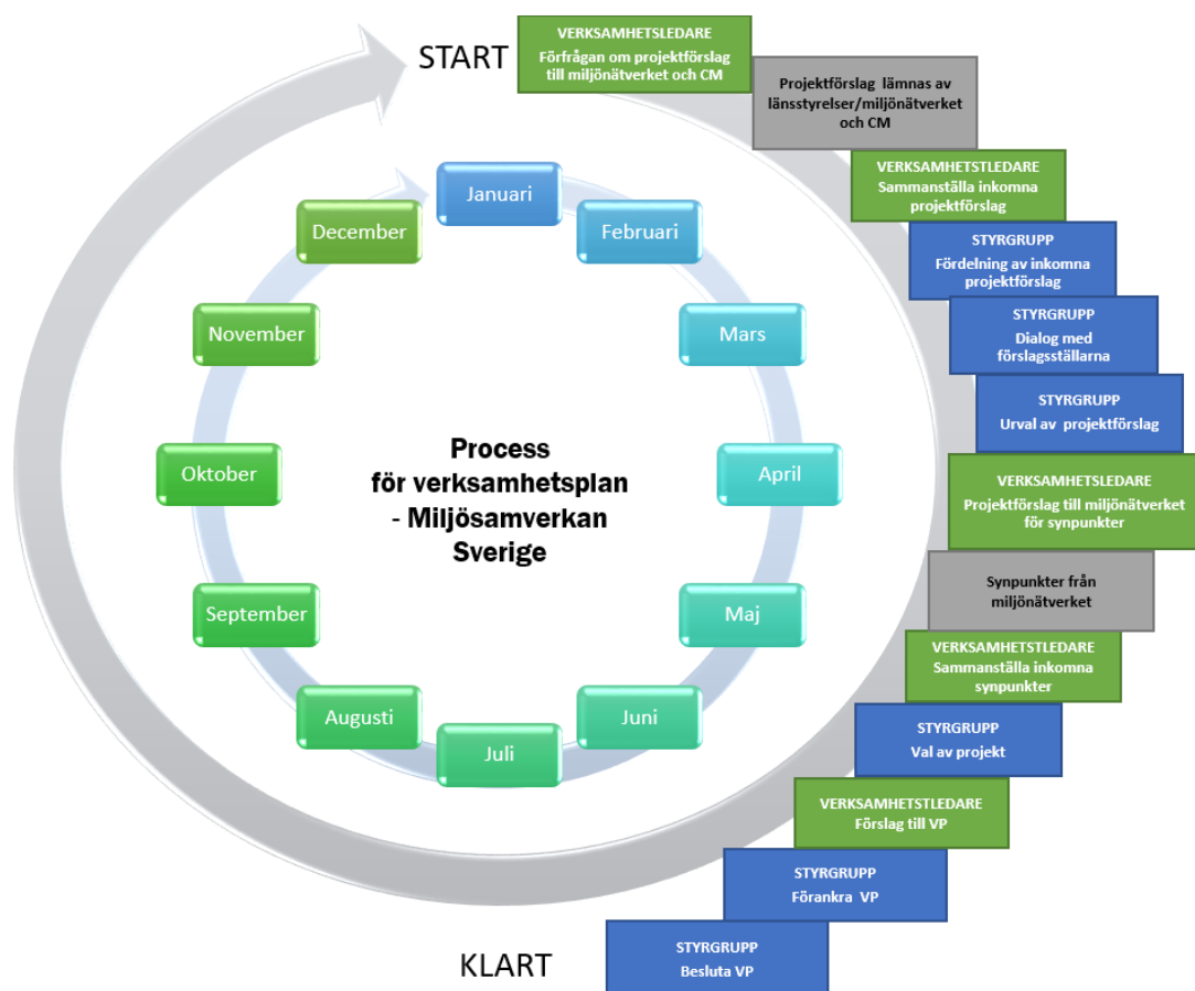
Figur 3 Skiss över verksamhetsplaneringen

Verksamhetsplanen är rullande på treårsbasis med en årlig uppdatering. Samma planeringscykel genomförs därför årligen.