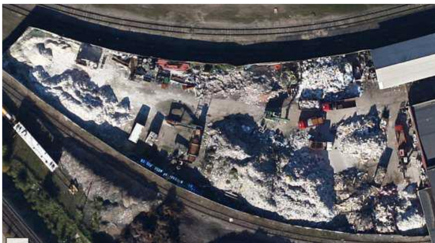
Figur 1: Översiktsbild från ärendet

En avfallsverksamhet i som tagit emot blandat avfall och bedrivit sorteringsverksamhet gick i konkurs år 2017. Stadens miljöförvaltning förelade fastighetsägaren att omhänderta avfallet.