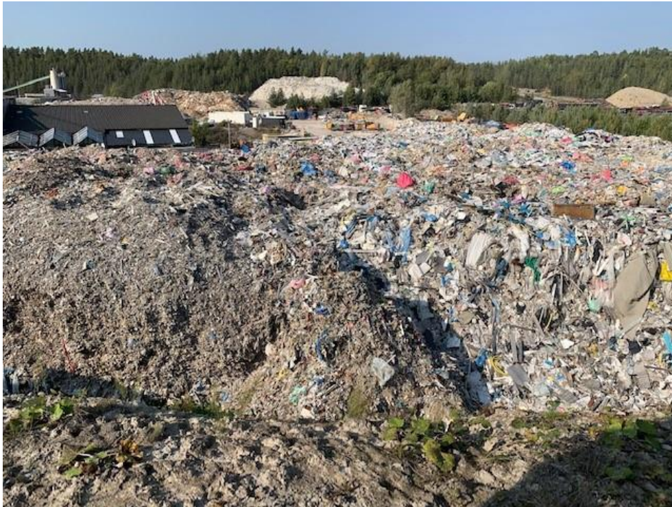
Figur 3: Översiktsbild över avfallet. Två avfallshögar med blandat bygg och rivningsavfall

Kommun ansökte om akutbidrag från Naturvårdsverket för att omhänderta avfallet på den felandes bekostnad enligt miljöbalkens 26 kap. 18 §. Kommun tilldelades bidrag från Naturvårdsverket om 42 miljoner för bortforsling av avfall som var äldre än tre år samt beredskap för lakvattenhantering.