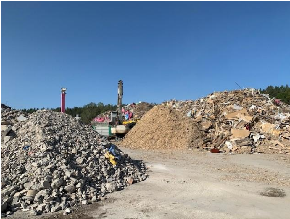
Figur 4: Uppsorterade avfallsfraktioner avseende schaktmassor, flisat trä och blandat trä.