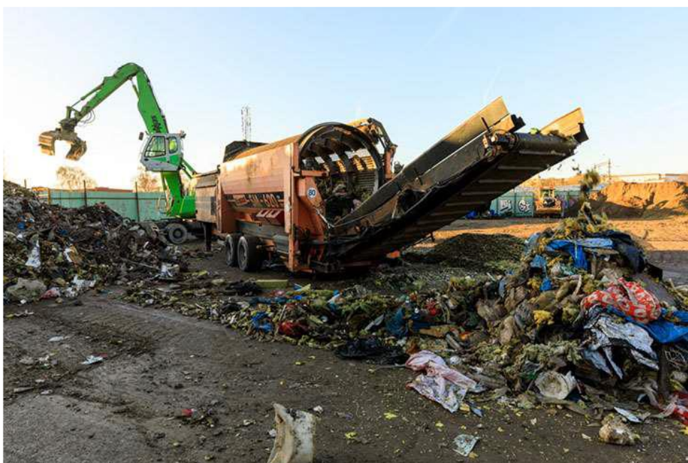
Figur 2: Materialsortering av avfall med sikt vid avfallsomhändertagandet

Massorna från den hög som noterats som inert material blev efter provtagning och analys bedömda som förorenade massor och deponerades.