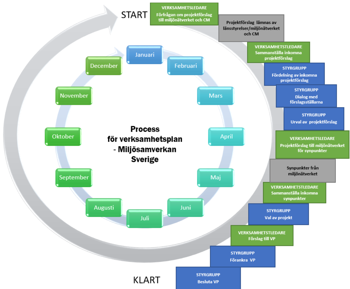
Bild. Skiss över verksamhetsplaneringen.

Verksamhetsplanen är rullande på treårsbasis med en årlig uppdatering. Samma planeringscykel genomförs därför årligen.